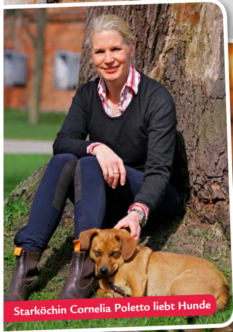
Starköchin Cornelia Poletto liebt Hunde