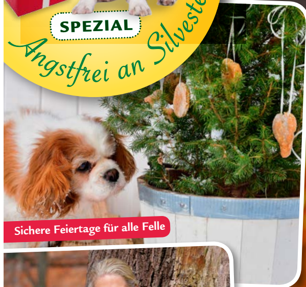
Sichere Feiertage für alle Felle