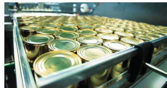
Futter aus der Metzgerei: Blick in die Produktion