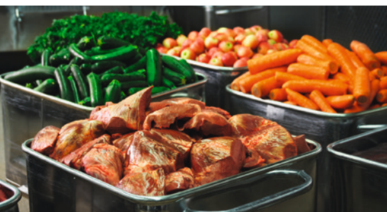
Nur beste Zutaten: Das Futter ist exakt auf die Bedürfnisse des Tieres abgestimmt