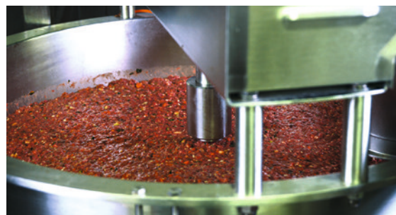
Lebensmittelqualität: Es werden nur Zutaten verwendet, die lebensmitteleuglich sind